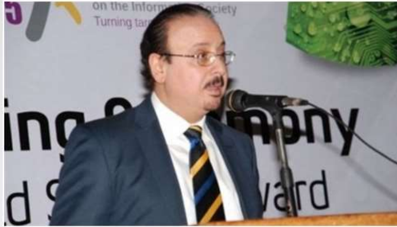
المهندس ياسر القاضي، وزير الاتصالات