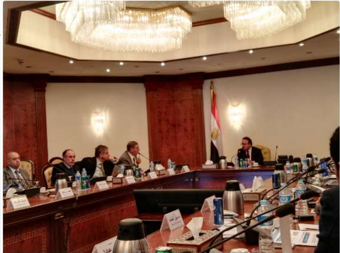
وزير الاتصالات و أعضاء شعبة الاقتصاد الرقمي