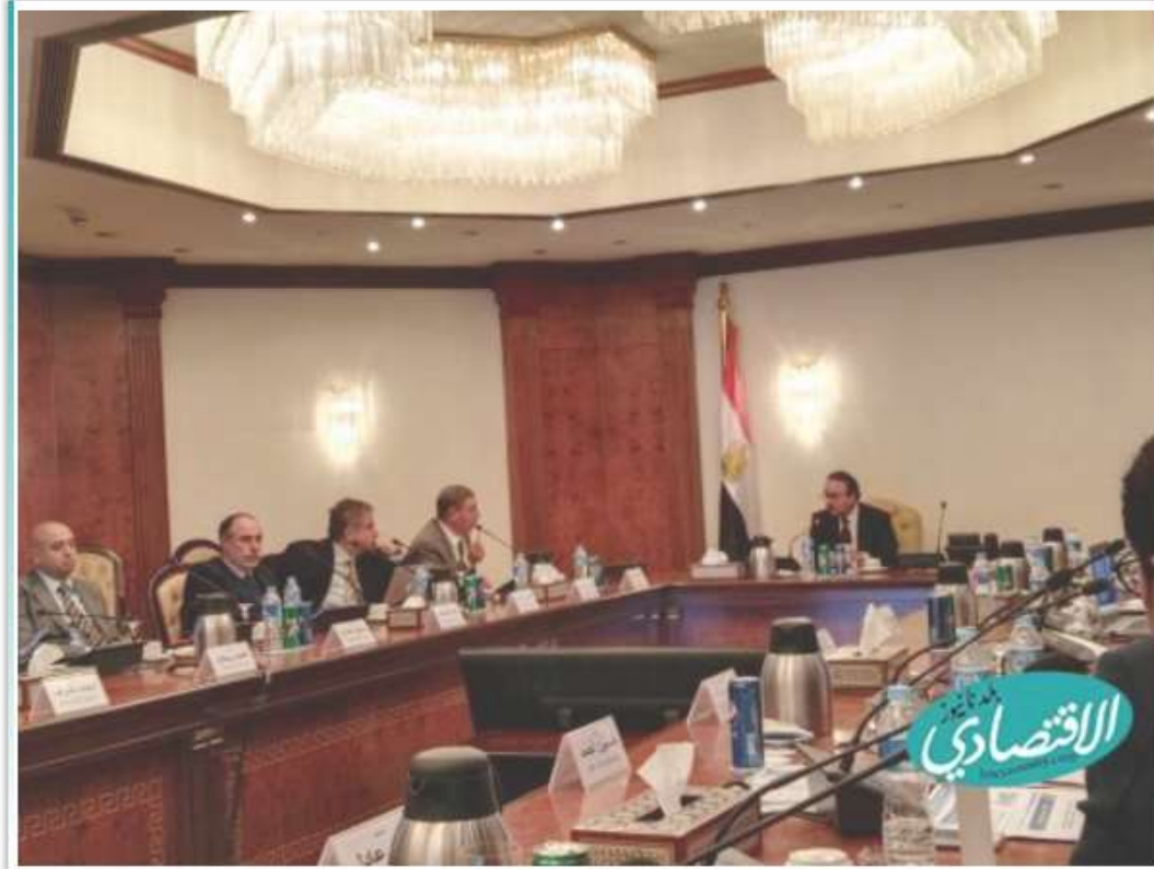
لقاء الفاضلي مع الشحنة العامة للاقتصاد الرفعي